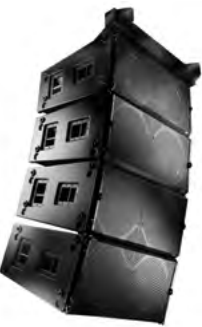
4 subwoofery WL218-sw podwieszane pod ramą AF218-sw.