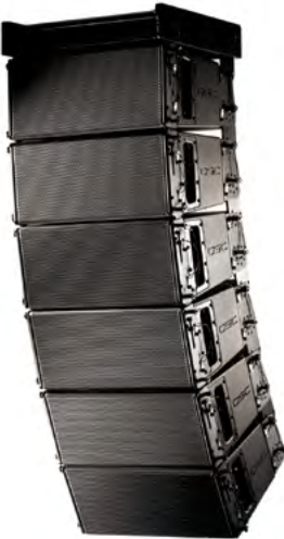
WL3082 w konfiguracji podwieszanej z AF3082-S

Zaprojektowany pod kątem użycia w najbardziej wymagających aplikacjach koncertowych i stacjonarnych, system WideLine-8 oferuje właściwości pełnowymiarowego systemu wyrównanego liniowo w ultra kompaktowej formie. Jest on idealnym rozwiązaniem w przypadku obiektów o niewielkiej wysokości lub z ograniczeniami widoczności.