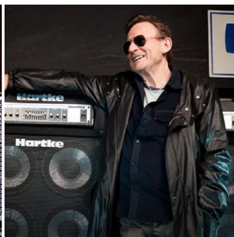
Jack Bruce (Cream)

Hartke to jedna z najsłynniejszych firm produkujących sprzęt dla basistów, w szczególności wzmacniacze i kolumny głośnikowe. To już kolejna kultowa marka dostępna w portfolio Aplauz. Zasłynęła w 1985 roku rewolucyjnym projektem głośnika basowego, w którym istotną rolę grało (dosłownie!) aluminium. Dzięki głośnikowi z aluminiową membraną bas wreszcie stał się słyszalny z nieznaną dotychczas dynamiką. Od tego czasu Hartke zainspirowało całą generację muzyków.