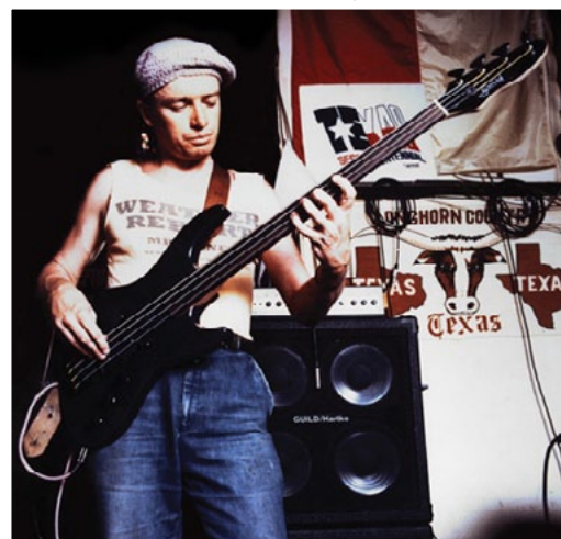
Jaco Pastorius ↓