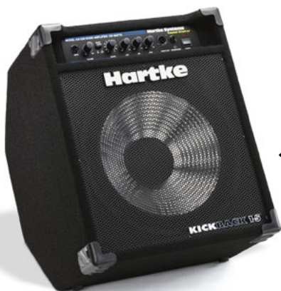
← Hartke Kickback 15