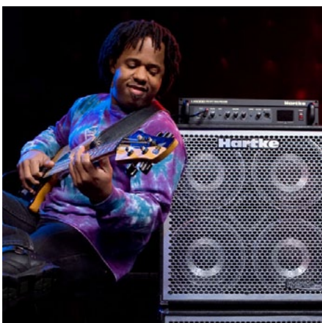
Victor Wooten (solo)