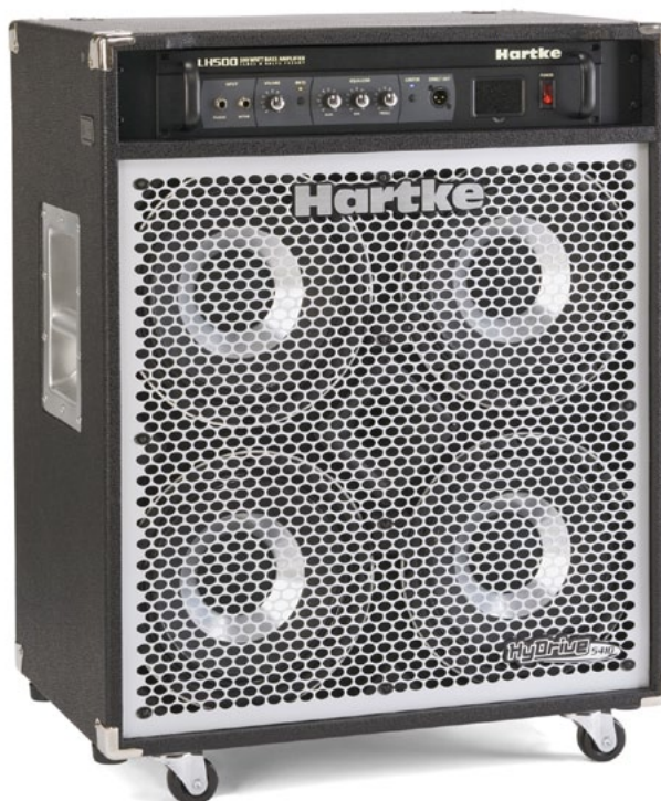
Hartke HiDrive 5410C →