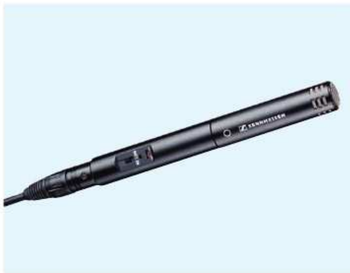
Moduł zasilający K 6 przedstawiony na ilustracji nie wchodzi w skład standardowego wyposażenia..

ME 62 jest kapsułą mikrofonową do modułu zasilająco-wyjściowego K 6 lub K 6-P. Kapsuła jest polecana do zastosowań reporterskich oraz rejestracji dźwięków otoczenia. Powierzchnia zewnętrzna z matowo-czarną powłoką galwaniczną odporną na zarysowania.